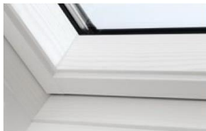
Holz weiß lackiert