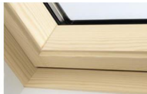
Holz klar lackiert